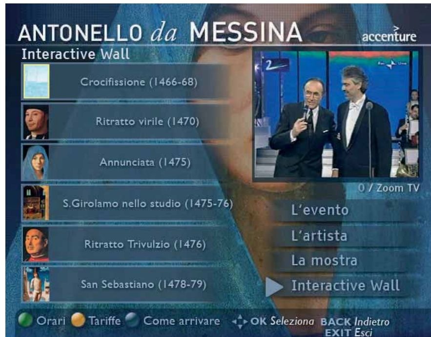
1. La versione mobile del sito della mostra