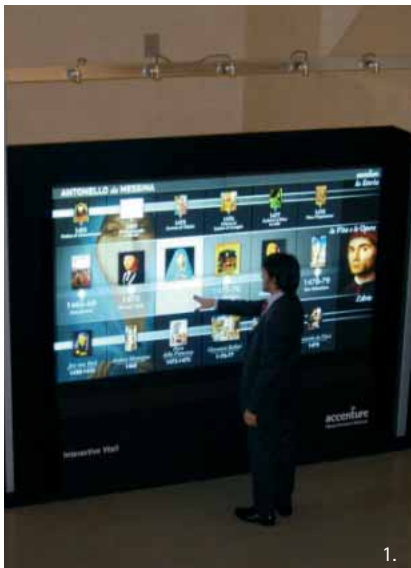
1. Il pubblico della mostra interagisce con l'Interactive Wall